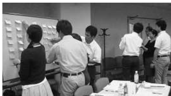
—平成28年度の講義風景— (特許情報戦略グループワーク)

受講証等の発行はいたしませんので、当日、直接会場へお越しください。定員オーバーのため、ご参加頂けない場合のみ連絡させていただきます。 尚、E-mailでお申込の場合は、受信確認の返信をいたします