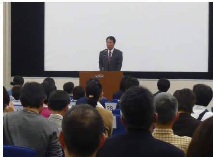
表彰式の様子 (第39回)