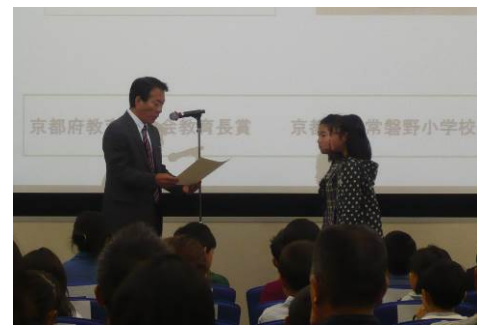
表彰式の様子 (第39回)