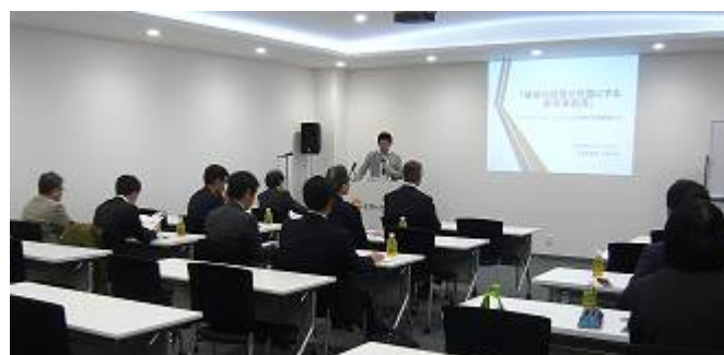
代表取締役 竹田様によるプレゼンテーションの様子