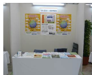
京都発明協会のブース