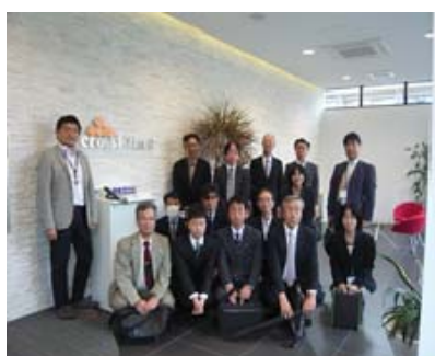
社屋にて見学会参加者様と

京都発明協会主催による見学会を平成28年10月25日（火）に株式会社クロスエフェクト様において開催いたしました。