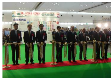
オープニングセレモニーの様子

10月19日（水）・20日（木）に京都府総合見本市会館（京都パルスプラザ）において開催された中信ビジネスフェア2016「第28回 大商談会」に出展し、京都発明協会各種事業のPR活動を行いました。